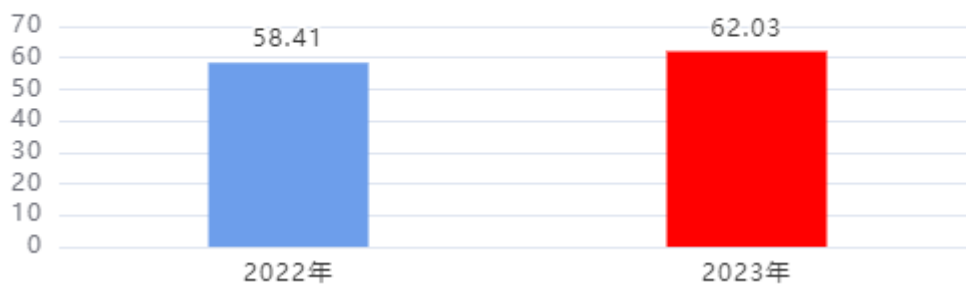
财政拨款收入、支出总计对比图（单位：万元）